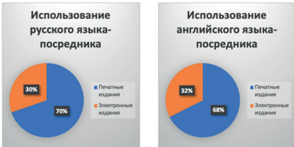
Рис. 2. Диаграммы долевого распределения показателей используемых учебных изданий студентами международного факультета с учетом используемого языка

Студенты, говорящие на русском языке, также больше внимания уделяют печатным изданиям и в меньшей степени используют электронные ресурсы [8].