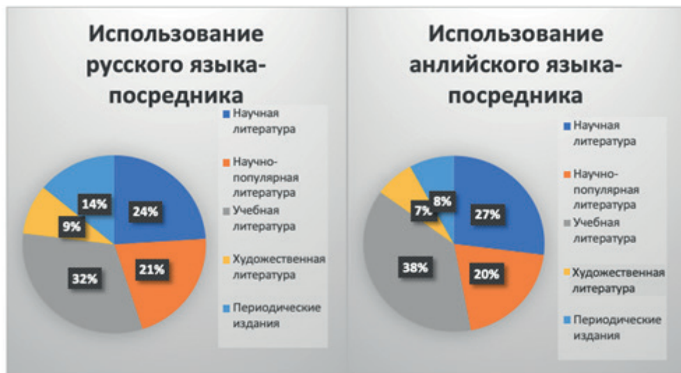
Рис. 3. Диаграммы долевого распределения видов изданий в образовательном процессе студентов международного факультета с учетом используемого языка

Если рассмотреть более подробно, какие именно печатные материалы используют русскоязычные и иностранные студенты, обучающиеся на других языках, то можно определить, что и те и другие ставят на первое место учебную литературу, научную, далее следует использование научно-популярной литературы и периодических изданий, в меньшей степени задействована художественная литература (рис. 3).